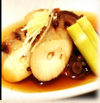
活蛸やわらか煮 六五〇円