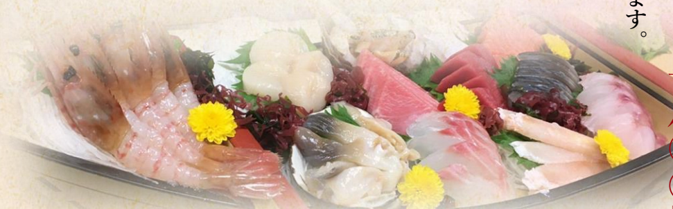
お造り盛り (大皿) 要予約