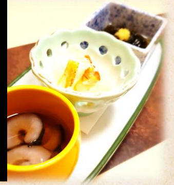
小付け 酢の物三種 七八〇円