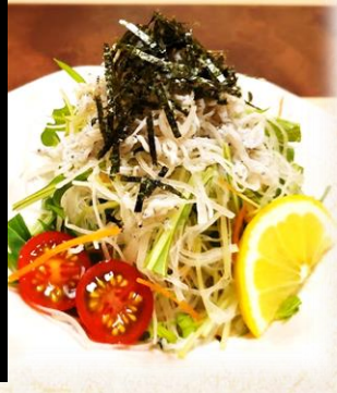
じゃこと 刻み野菜サラダ 六五〇円