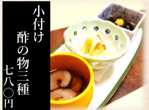
小付け 酢の物三種 七八〇円