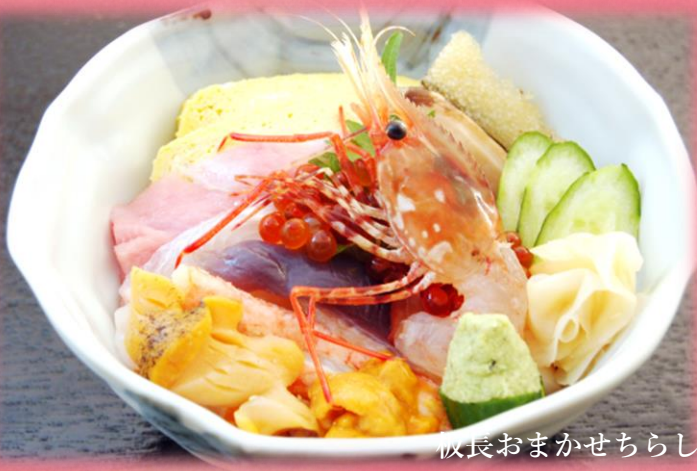
板長おまかせちらし