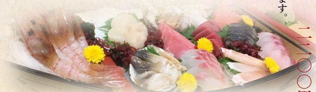
お造り盛り (大皿) 要予約