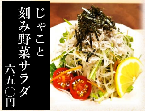
じゃこと 刻み野菜サラダ 六五〇円