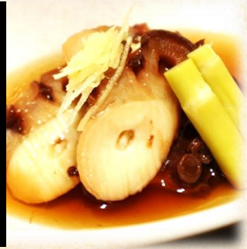
活蛸やわらか煮 六五〇円